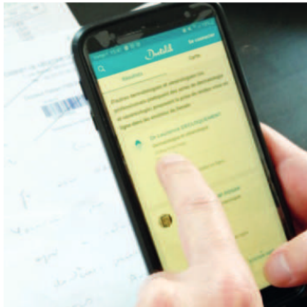
Prendre son rendez-vous au CH de Denain directement sur son smartphone, c'est désormais possible.