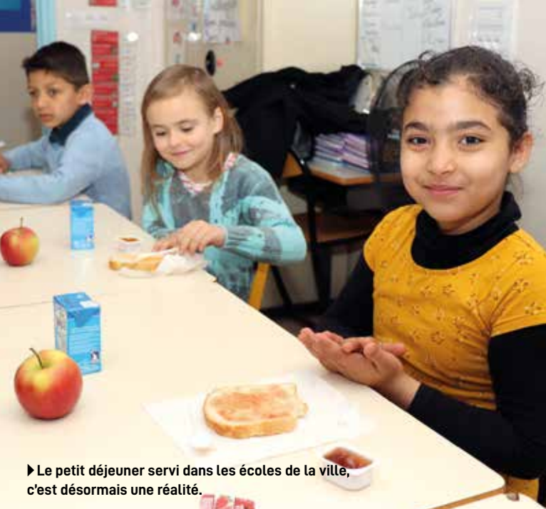
► Le petit déjeuner servi dans les écoles de la ville, c'est désormais une réalité.