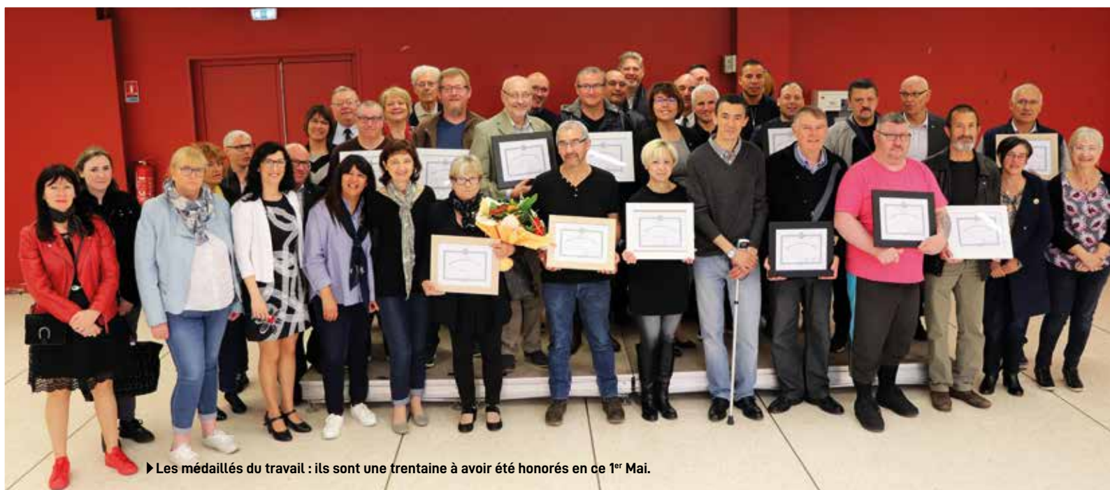
► Les médaillés du travail : ils sont une trentaine à avoir été honorés en ce 1 er Mai.