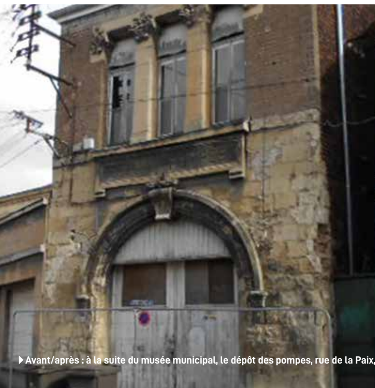
► Avant/après : à la suite du musée municipal, le dépôt des pompes, rue de la Paix, a bénéficié d'une rénovation extérieure. Quelle différence !