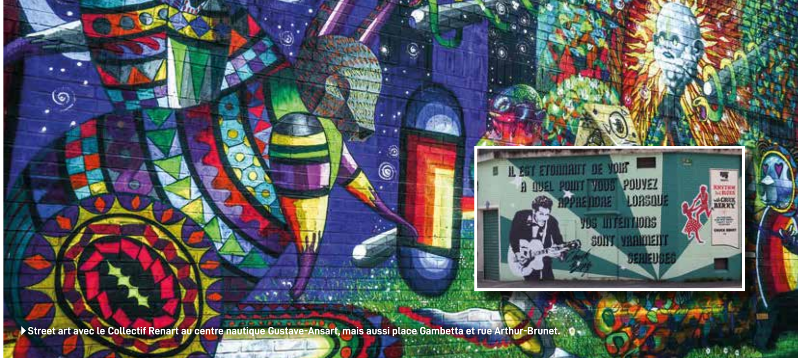
► Street art avec le Collectif Renart au centre nautique Gustave-Ansart, mais aussi place Gambetta et rue Arthur-Brunet.