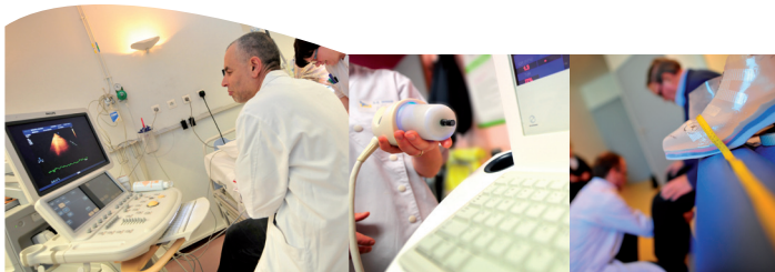
*Activité en 2014