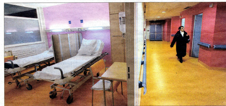
Treize lits supplémentaires complètent le service de chirurgie du centre hospitalier de Denain.

Tout le monde a ensuite découvert l'IRM, et écouté avec attention les explications des spécialistes sur son utilisation avant de visiter les nouveaux locaux construits pour abriter les lits supplémentaires consacrés à la chirurgie B. ■