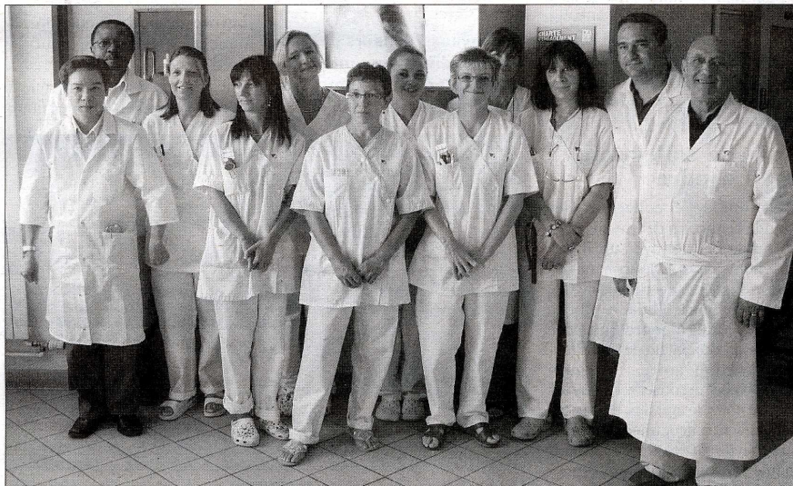
Une partie de l'équipe qui travaille au service pneumologie du centre hospitalier de Denain.

► Les consultations d'aide au sevrage tabagique ont lieu chaque jeudi (☎ 03 27 24 31 69). ► Site Internet de l'hôpital : ch-denain.fr