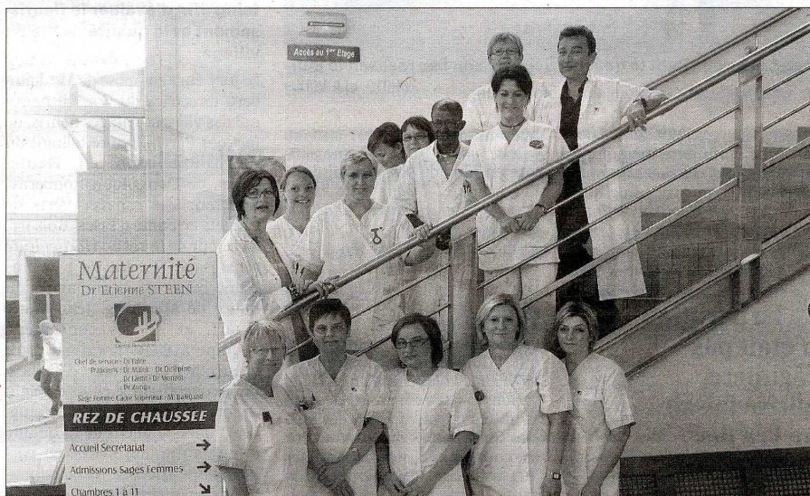
Dans un hall inauguré en 2002, une partie de l'équipe de la maternité.